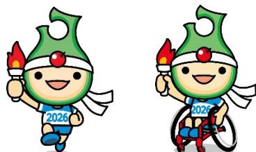
青の煌めきあおもり国スポ・障スポ 公式マスコット「アプリート君」