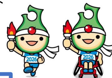
公式マスコット アップリート君

これらの標章等を使用する際は用途（非営利（公共目的）・営利（商業目的））に関わらず、 申請手続き が必要となります。（次ページ参照） なお、営利目的の使用の場合は、 使用料 の納付が必要になります。