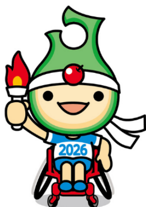
大会マスコット アップリート君