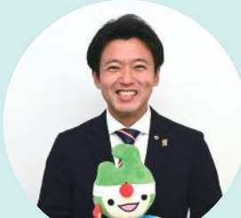
青森県知事 宮下 宗一郎