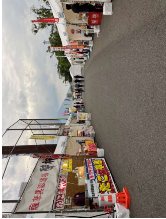
おもてなし広場 (ぐりぶー広場)