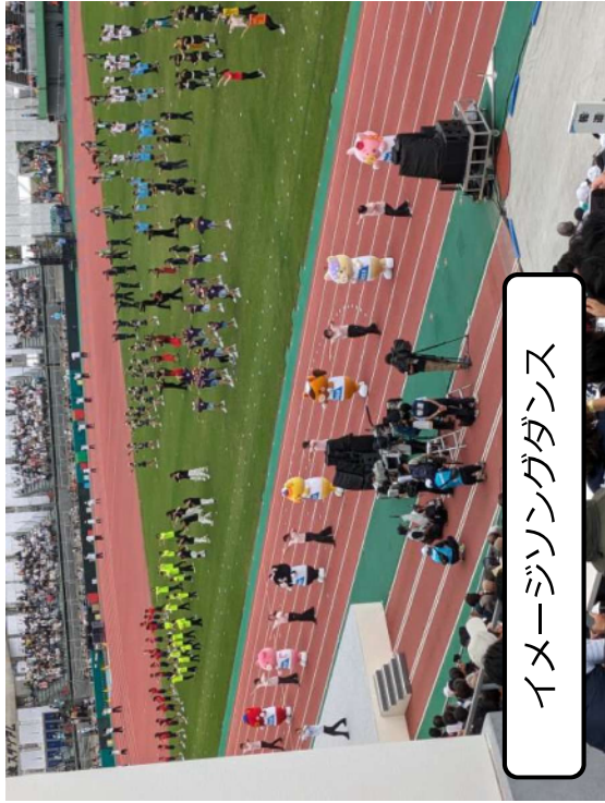
イメージソングダンス