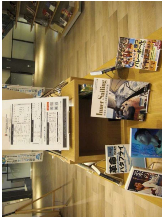
かごしま国体関連展示（市立天文館図書館）