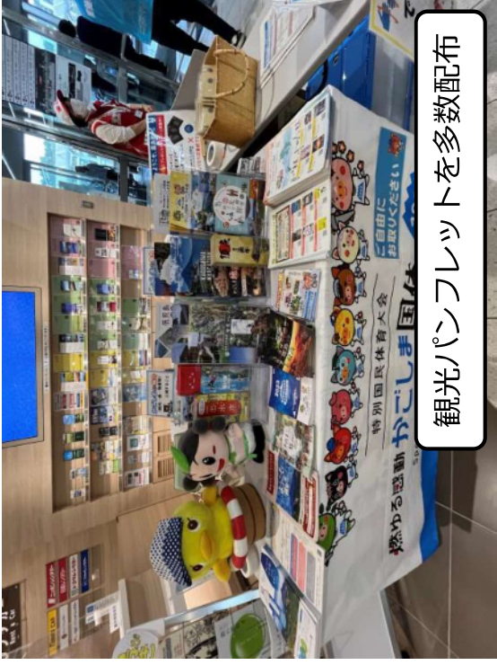
観光パンフレットを多数配布