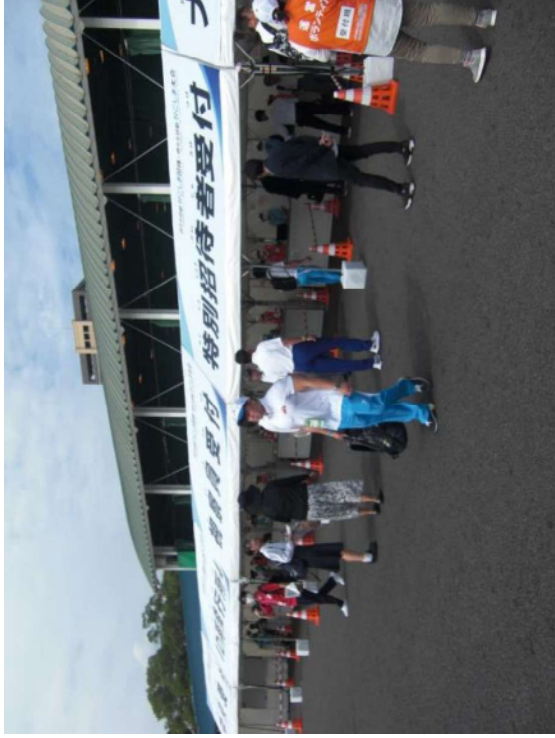
中央受付 (大会役員、特別招待者、視察員等)