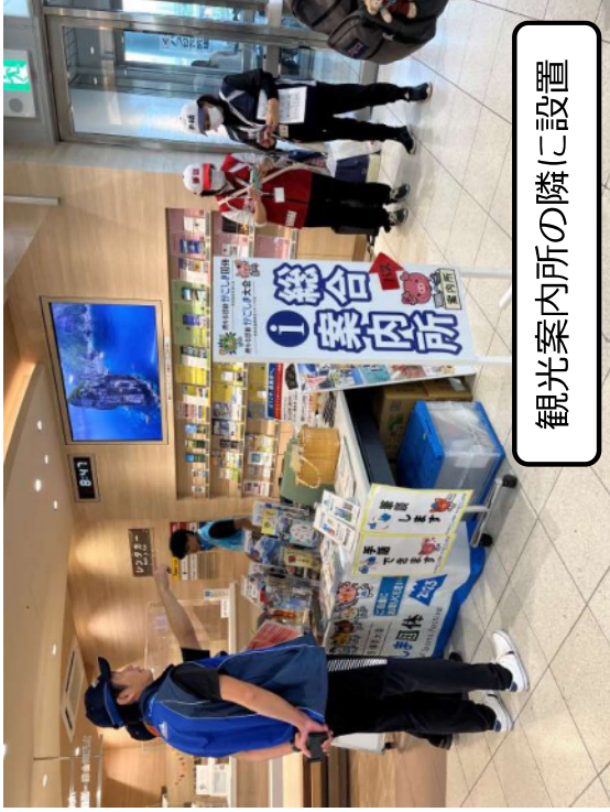
観光案内所の隣に設置