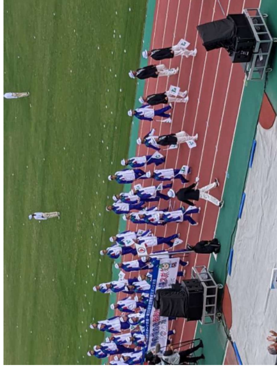
青森県選手団入場