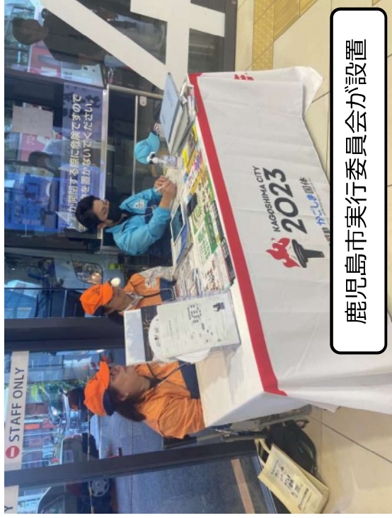
鹿児島市実行委員会が設置