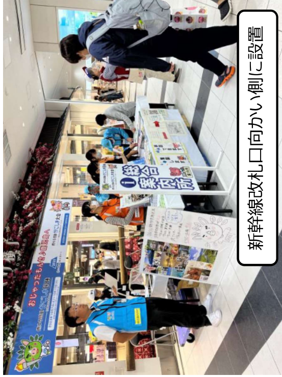
新幹線改札口向かい側に設置