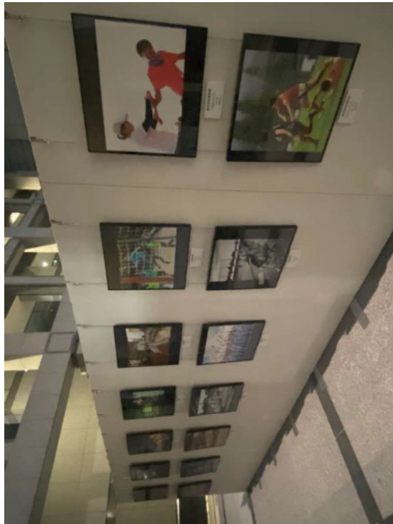
全国スポーツ写真展（県庁1階ロビー）