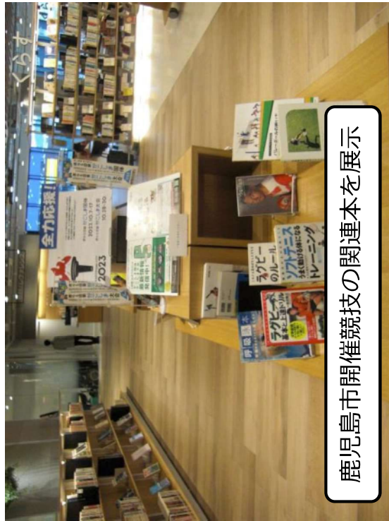
かごしま国体関連展示（市立天文館図書館）