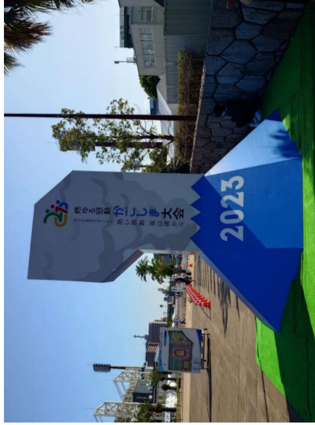
会場正面歓迎ゲート

1972年に開催された第27回国民体育大会（太陽国体）の会場として使用することを念頭に1970年12月に完成。サッカーを中心とした球技場としても使用されている。正式名称は、鹿児島県立鴨池陸上競技場。収容人数は、約15,000人。