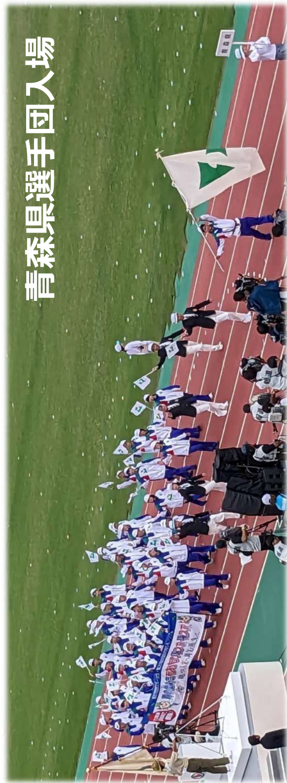
青森県選手団入場