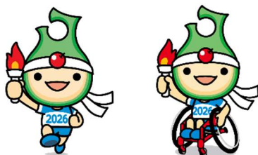
公式マスコット「アップリート君」