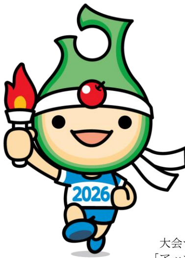
大会マスコット 「アップリート君」