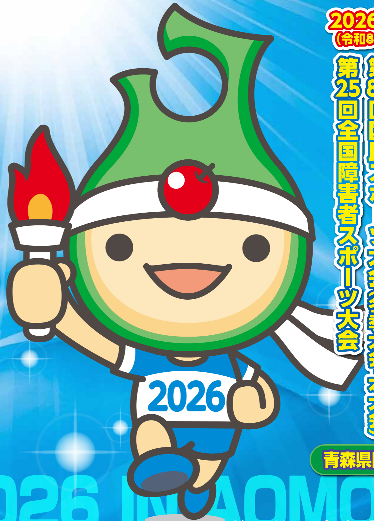
大会マスコットキャラクター「アップリート君」