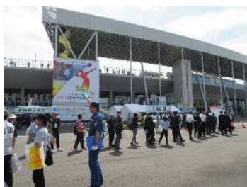
総合開閉会式会場