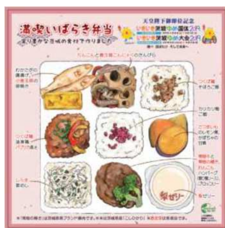
総合開会式 式典弁当