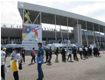
総合開閉会式会場