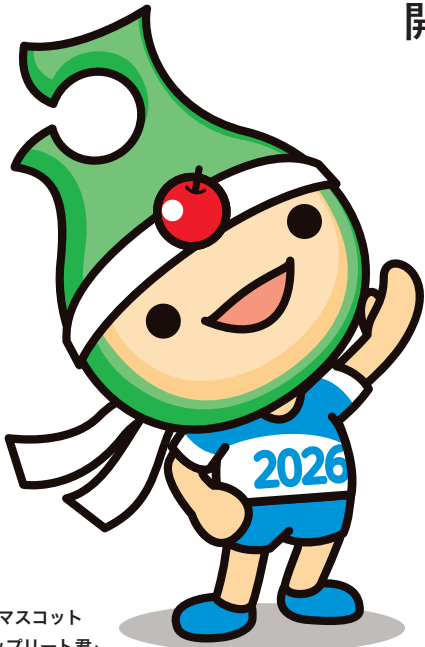
公式マスコット 「アップリート君」

2026年に青森県で開催する青の煌めきあおもり国スポの実施競技の中には、デモンストレーションスポーツ、通称「 デモスポ 」と呼ばれる、子どもからご高齢の方まで県民の皆さんが気軽に参加できる競技があります。